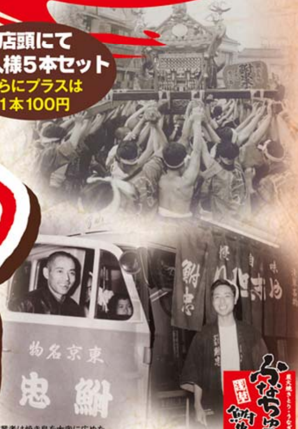
創業者は焼き鳥を大衆に広めた「焼き鳥の父」と呼ばれています。